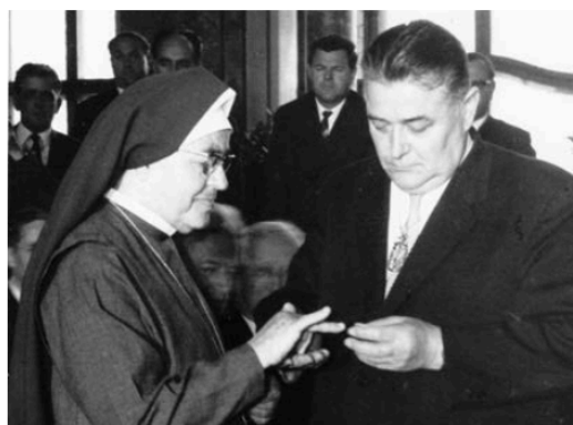
Anna Dengel im Jahr 1966 im Rahmen der Verleihung des Ehrenringes des Landes Tirol. Im Bild mit dem ehemaligen Tiroler Landeshauptmann Eduard Wallnöfer.